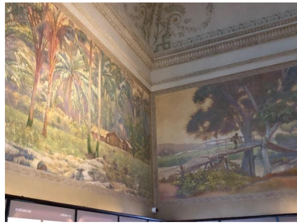
Prachtige schilderijen (ca. 1930).