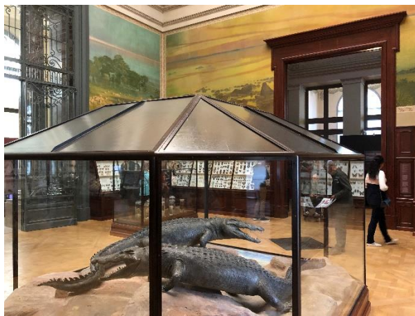
De Krokodillenzaal (ca. 1930).