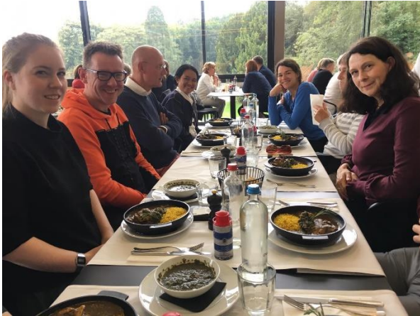
Lunch in museum (foto links: Thijs van Roon).