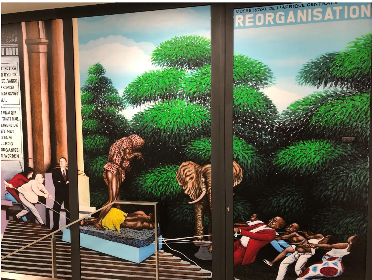
De renovatie van het museum verbeeld met strijd tussen directie en pressiegroepen.