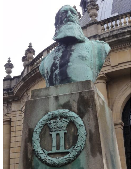
Het museum vòòr de renovatie, met koning Leopold II nog op z'n voetstuk (2013).