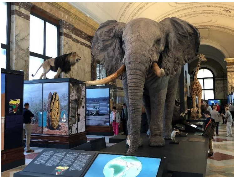
Opgezette olifant t.b.v. wereldtentoonstelling (1958).