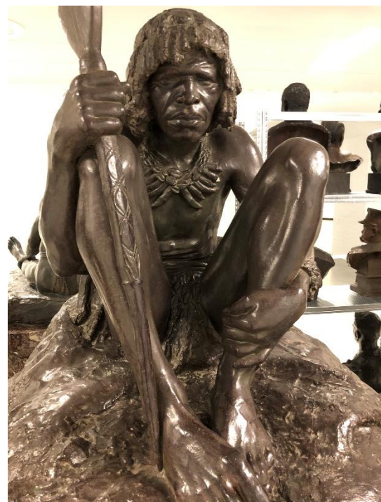
Omstreden beelden met raciale stereotypingen, waar onder de Luipaard-man.