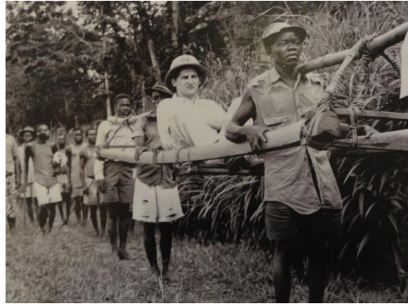
Aard van het Belgische koloniale bewind in Kongo.